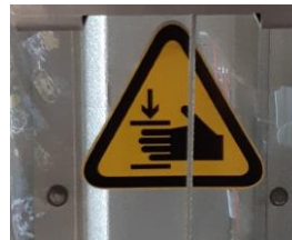
Plexiglas bescherming om o.a. de handen te beschermen