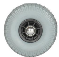
13653 Lekvrije band (opgeschuimd polyurethaan)