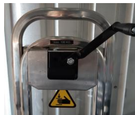
Ratel met terugloopblokkering